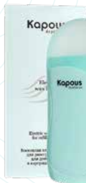
Профессиональный электрический воскоплав для картриджей 100 мл