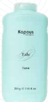
Тальк, 200 г Арт. 1658