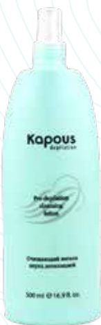
Очищающий лосьон перед депиляцией, 500 мл Арт. 540