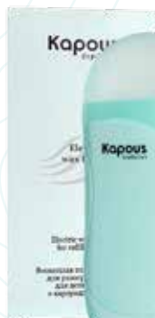
Профессиональный электрический воскоплав для картриджа 100 мл Арт. 617