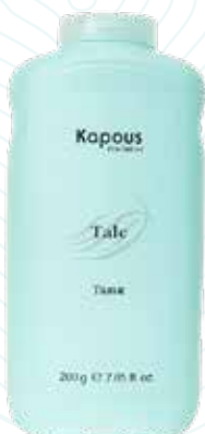
Тальк, 200 г Арт. 1658