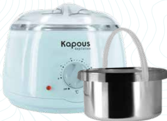
Воскоплав электрический для воска в банке 400 мл Арт. 555