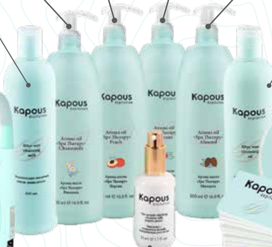
Эмульсия с экстрактом папайи, замедляющая рост волос, 50 мл Арт. 1239