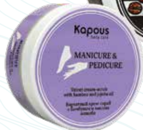
Крем-скраб с бамбуком и маслом жожоба Karous Body Care, 200 мл Арт. 2263