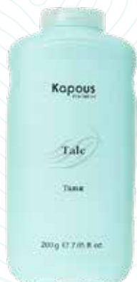
Тальк, 200 г Арт. 1658