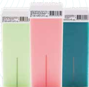
Жирорастворимый воск в картридже, 100 мл в ассортименте.* * - весь ассортимент смотрите на сайте www.kapous.ru