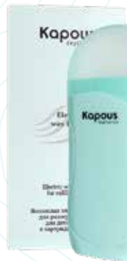
Профессиональный электрический воскоплав для картриджей 100 мл Арт. 617