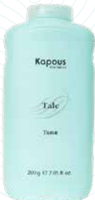
Тальк, 200 г Арт. 1658