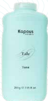
Тальк, 200 г Арт. 1658