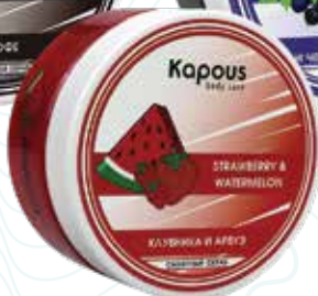
Сахарный скраб «Клубника и Арбуз» Karous Body Care, 200 мл Арт. 2265