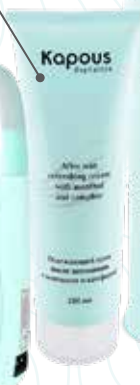
Эмульсия с экстрактом папайи, замедляющая рост волос, 50 мл