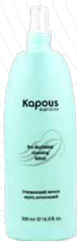
Очищающий лосьон перед депиляцией, 500 мл Арт. 540