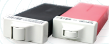
Жирорастворимый воск в картридже с мини роликом, 100 мл* Жирорастворимый воск в картридже с узким роликом, 100 мл* * - весь ассортимент смотрите на сайте www.kapous.ru