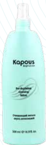
Очищающий лосьон перед депиляцией, 500 мл Арт. 540