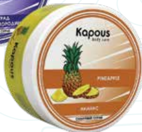
Сахарный скраб «Ананас» Karous Body Care, 200 мл Арт. 2264