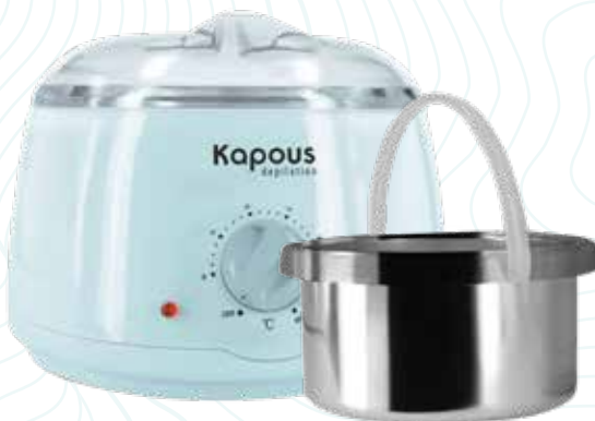
Воскоплав электрический для воска в банке 400 мл Арт. 555