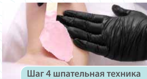
Шаг 4 шпательная техника