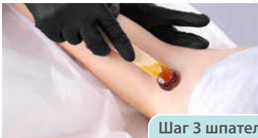
Шаг 3 шпательная техника