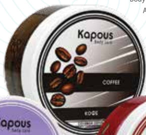
Солевой скраб «Кофе» Karous Body Care, 200 мл Арт. 2267