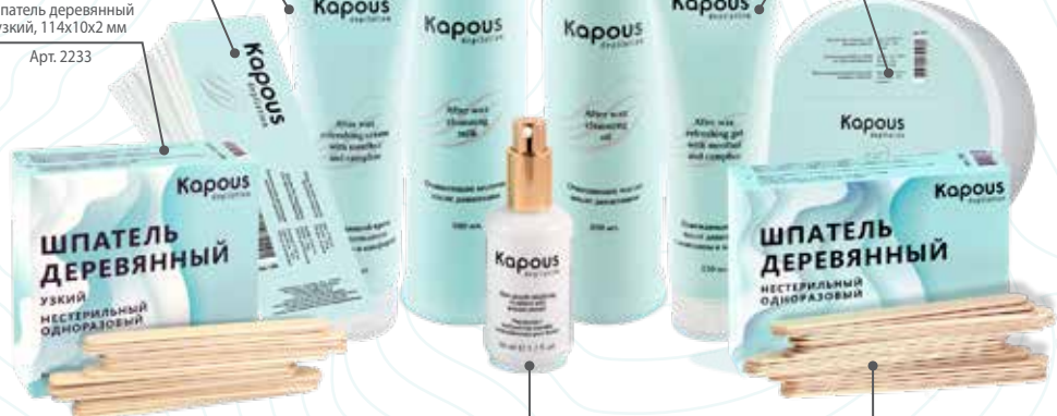
Эмульсия с экстрактом папайи, замедляющая рост волос, 50 мл