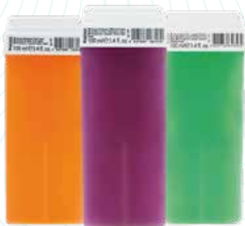
Гелевый воск в картридже Kapous depilation (в ассортименте)* * - весь ассортимент смотрите на сайте www.kapous.ru