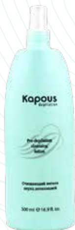
Очищающий лосьон перед депиляцией, 500 мл Арт. 540