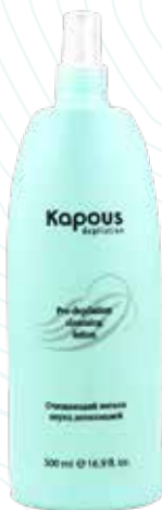
Очищающий лосьон перед депиляцией, 500 мл Арт. 540